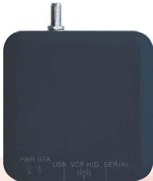
外部端子型1ポート UHF帯RFIDリーダライタ RWLU3001