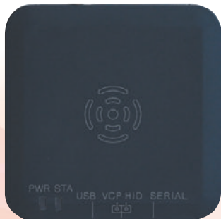
アンテナ一体型 UHF帯RFIDリーダライタ RWLU3000