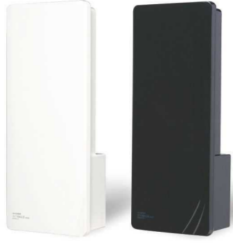
ウォームホワイト ブラック